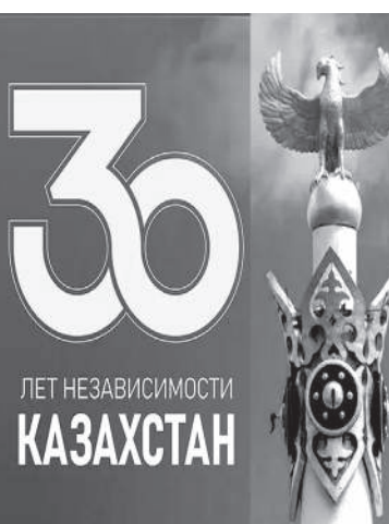
Подготовила Кальбинур ХОШНАЗАРОВА

Мақала менің қазақша түсіну деңгейім бойынша ашық түрде жазылған. Қазақ елінің жеке дербес мемлекет атанып, тәуелсіздікке дейін жету жолында қаншама қиын-қыстаудан өткені жақсы жазылған. Егемендікке жеткеннен кейін де ел жағдайының көтерілуі мен дамуына қыруар еңбек, күш-қуат жұмсалғанын Елбасы осы мақаласында атап көрсетеді. Қай ой толғанысын алып қарасам да, ұлтына қарамастан халқының тек бірлік пен келісім, бейбітшілікте өмір сүруін көздеген көшбасшы Қазақ халқын бүкіл әлемге мәдениеті, тарихы, өркениеті арқылы танытып, мойындаққан екен, өзіндік саясаты көрген, мықты болған. Тәуелсіздіктің алғашқы күндерінен бастап біз береке-бірлікке, ынтымаққа, ұлттаралық татулық пен диалалық келісімге негізделген саясатты жүзеге асырдық. Бұл елімізді үздіксіз өсу мен өркендеуге бастады. Осының қадірін білуіміз керек. «Бірлігі бар ел озады», — дейді дана халқымыз. - деп сындарлы саясат ұстанып келген Елбасымыз аман-өсен болсын! Күш-жігері сөмбесін! Жас ұрпақ тәуелсіздіктің қандай қанмен, қандай күшпен келгенін біліп өскені абзал. Жамбыл облыстық ҚХА Аналар кеңесінің жетекшісі ретінде осы бала төрбиесі жағынан жастарға бар ұлағатты төрбиемізді беруге бар күшімізді саламыз!