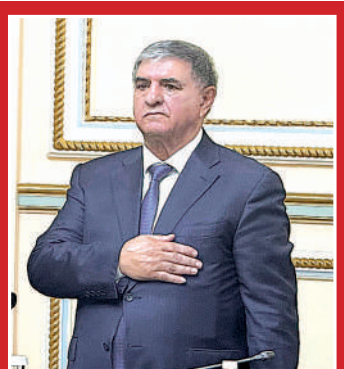
Юбилей азербайджанского этнокультурного центра в Алматы