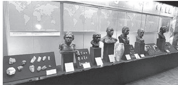
Музейге айына қанша адам келеді. Оның қаншасы шетелдік туристер?

Еліміздің басты музейінің бірі — ҚР Мәлекеттік Орталық музейі отандық музей ісінің көшбасшысы. Ал оның бай қорлары мен сәулетті залдарынан халқымыздың ұлттық құндылығынан мағлұмат алу үшін еліміздің түктір-түкірінен және шетелдерден көрермендер келіп келеді. Келушілер саны жыл сайын 130 мың адамнан асады. Соңғы үш жылдық көрсеткіштерге сүйенсек келушілер саны тұрақты түрде артып келе жатқанын көруге болады. Мәселен, 2021 жылы — 74 701 адам, 2022 жылы — 137 662 адам, ал 2023 жылы — 149 234 көрермен келген екен.