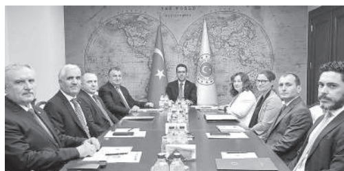
DATÜB Genel Başkanı Ziyatdin Kassanov Dışişleri Bakan Yardımcısı Yasın Ekrem Serim'i ziyaret etti

Dünya Ahıska Türkleri Birliği (DATÜB) Genel Başkanı Ziyatdin Kassanov, beraberinde heyette Dışişleri Bakan Yardımcısı Yasın Ekrem Serim'i ziyaret etti. Kassanov, Serim'e DATÜB'in çalışmalarını ve gelecek dönem planlamaları hakkında bilgi verdi ve Ahıska Türklerinin selamını ilettili. Serim ise Türkiye Cumhuriyeti olarak DATÜB'e olan güçlü desteği bir kez daha ifade ederek ziyaretten memnuniyeti dile getirdi.