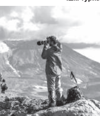
Ішкі туризмді дамытудағы рөл

салы және бар нысандарды жаңғырту бойынша жұмыстарды жалғастырады. Мысалы, Түркістан облысында Бұқаратүркістан жобалар іске асырылып жатыр, бұл облысты ішкі ту-ризм орталықтарының бірі ретінде қалыптастыруға бағытталған.