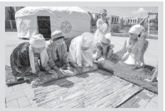
Этно-лагерь для школьников провели в Астане

В акции приняли участие учащиеся начальных и 11-х классов