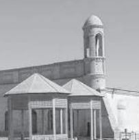
Арыстан баб кесенесі мұсылман ағамында маңызды зиярат орындарының бірі болып табылады. Қазақстанның түгір-түгірінен және шетелден келген зияратшылар кесене-не көліп, Арыстан бабтың рухына дұға етеді. Бұл жерде рухани тазару,

ұмтылады. Арыстан баб туралы көптеген аңыздар мен мифтер сақталған. Олардың бірі бойынша, Арыстан баб Мухаммед пайғамбардың аманатын Қожа Ахмет Йсауиге жеткізуге тапсырылған. Бұл аманат құрға болған және ол Арыстан бабтың қолында 400 жыл бойы сақталған деген аңыз бар. Басқа аңыздарда Арыстан бабтың ерекше қабілеттері мен ғажапайтырауы туралы айтылады. Бұл оның рухани мәртебесіне одан әрі көтереді.