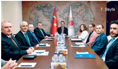
DATÜB Genel Başkanı Ziyatdin Kassanov Dışişleri Bakan Yardımcısı Yasin Ekrem Serim'i ziyaret etti

Bu vesileyle, önemli olduğunu düşündüğüm birkaç hususa da dikkatinizi çekmek istiyorum. Topamlar, birlik ve beraberlik içerisinde olduğu öteden beri güçlüdür ve hak etikleri saygıyı görürler. Türk vatandaşlığına geçişler dahil Ahıska Türk toplumunu ilgilendiren tüm konularda eş güdüm içinde hareket edelim. Sizlerden büyüklük ve başkonsolosluğumuzla Dünya Ahıska Türkleri Birliği ile yakın koordinasyon içinde olmanızı özellikle rica ediyorum. Ahıska Türklerinin bulunduğu ülkelerde kimliklerini, dillerini, dinlerini ve kültürlerini korumaları önceliklerimiz başında geliyor. Bu doğrultudaki çalışmalarınıza katkılarınızı sürdüreceğiz.