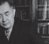
Президент Касым-Жомарт Токаев побывал в недавно открытом Дворце школьников в Пришатиинске, а также в недавно отремонтированном Доме культуры и в физкультурно-оздоровительном комплексе села Шахтёрского Нуринского района.

ства. Наша страна до сих пор пользуется плодами его трудов. Наследие Сатпаева является уникальной сокровищницей нашей нации. Популяризация его трудов — наш общий долг. Я уверен, что преемники Каныша Сатпаева найдут продолжение в современной казахской науке. Он основал Национальную академию наук, воспитал целое поколение квалифицированных ученых, сформировал новую исследовательскую систему. Поэтому День работников науки в нашей стране приурочен к его дню рождения. Один из самых выдающихся людей нашего народа открыл множество месторождений, которые сыграли ключевую роль в развитии отечественного производ-