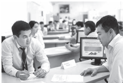
Халықтың табысын арттыру — басты назарда

стардың шығармашылық қабілеттерін арттыруға қоғамдық өмірге белсенді қатысуына және жеке дамуына жағдай жасайды. Алматы қаласы Жастар саясаты басқармасы — қала жастарына қолдау көрсететін және олардың өлеуетін дамытуға бағытталған бастамаларды жүзеге асыратын мекеме. Жастар саясаты басқармасы басшысының міндеті — жастарға қолайлы жағдай жасап, сапалы білімге, денсаулық сақтау және жұмыспен қамту мүмкіндіктеріне қол жеткізуге қамтамасыз ету.