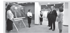
Глава государства ознакомился со школой-гимназией Косшы

Предприятие, оснащенное современным оборудованием и работающее по передовым мировым технологиям, производит 50