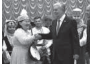
Президент ознакомился с производственными объектами агрофирмы «Родина»

Кроме того, Президент осматрел супермаркет «Наша родина», парк «Достық» и местную среднюю общеобразовательную школу.