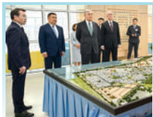
Касым-Жомарт Токаев ознакомился с планом развития Косшы Президент ознакомился с производственными объектами агрофирмы «Родина»

“Terörü, ülkemiz için bir tehdit kaynağı olmaktan çıkartana kadar mücadelemizi sürdüreceğiz”