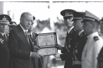
Cumhurbaşkanı Erdoğan, bugün 774 erkek, 82 kadın, 12 misafir olmak üzere toplam 868 subay ile 3 bin 34 erkekle, 215 kadın astsubay öğrencinin akademiden mezun etmenin mutluluğunu yaşadıklarını dile getirerek şunları kaydetti: «Boylece farklı branş, uyruk ve ırklarda toplam 4 bin 117 evladımızı yeni görev yerlerine uğurluyoruz. Bugüne kadar 4 bin 691 subay, 28 bin 878 astsubayımız jandarmaya, 391 subay, bin 116 astsubayımız ise Sahil Güvenlik Teşkilatımıza katıldı. Dest ve müteflik ülkelerden gelen 75 uluslararası öğrencimiz, akademideki eğitimlerini başarıyla tamamlayarak ülkelerine döndü. Aynı zamanda ülkemizin fahri eşiği olan bu kardeşlerimizin eğitimleriyle temyiz ettiklerini ve çok iyi yerlere geldiklerini görüyoruz. Sizlerin de katılmaya Jandarma ve Sahil Güvenlik Teşkilatımızın daha da güçleneceğine inanıyorum. İnşallah her biriniz, bugün burada olduğu gibi ailenizin ve milletimizin geleceğinin geleceğidir.»

“4 BİN 117 EVLADIMIZI YENİ GÖREV YERLERİNE UĞURLUYORUZ” Cumhurbaşkanı Erdoğan, bugün 774 erkek, 82 kadın, 12 misafir olmak üzere toplam 868 subay ile 3 bin 34 erkekle, 215 kadın astsubay öğrencinin akademiden mezun etmenin mutluluğunu yaşadıklarını dile getirerek şunları kaydetti: «Boylece farklı branş, uyruk ve ırklarda toplam 4 bin 117 evladımızı yeni görev yerlerine uğurluyoruz. Bugüne kadar 4 bin 691 subay, 28 bin 878 astsubayımız jandarmaya, 391 subay, bin 116 astsubayımız ise Sahil Güvenlik Teşkilatımıza katıldı. Dest ve müteflik ülkelerden gelen 75 uluslararası öğrencimiz, akademideki eğitimlerini başarıyla tamamlayarak ülkelerine döndü. Aynı zamanda ülkemizin fahri eşiği olan bu kardeşlerimizin eğitimleriyle temyiz ettiklerini ve çok iyi yerlere geldiklerini görüyoruz. Sizlerin de katılmaya Jandarma ve Sahil Güvenlik Teşkilatımızın daha da güçleneceğine inanıyorum. İnşallah her biriniz, bugün burada olduğu gibi ailenizin ve milletimizin geleceğinin geleceğidir.»