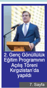
2. Genç Gönüllülük Eğitim Programının Açılış Töreni Kirgizistan'da yapıldı