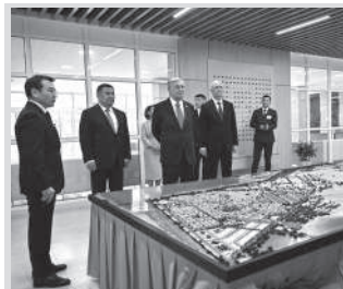
Касым-Жомарт Токаев ознакомился с планом развития Косшы