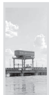
Таджикистан направил Казахстану около 500 млн кубометров воды