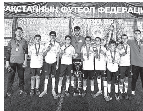
ФК Тельман 1-место

Осындай футбол өрежелерін сақтай отырып жеңімпаз аталған командалар төмендегіше болды: 1-ші орынды Тельман бөлімшесінің ойыншылары, 2 - ші орынды Қызылжар (Коммунизм) бөлімшесінің ойыншылары, 3-ші орынды Қайтпас бөлімшесінің ойыншылары, 4-ші орынды Карл Маркс бөлімшесінің ойыншылары иемденді.