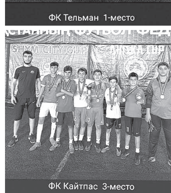
ФК Кайтпас 3-место